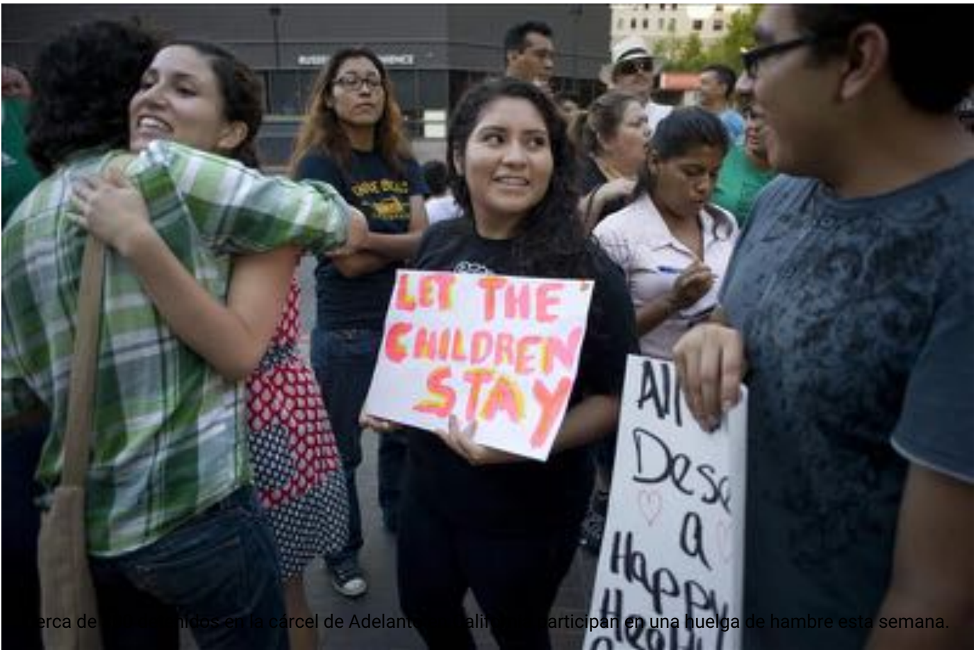
cerca de 300 detenidos en la cárcel de Adelanto en California participan en una huelga de hambre esta semana.